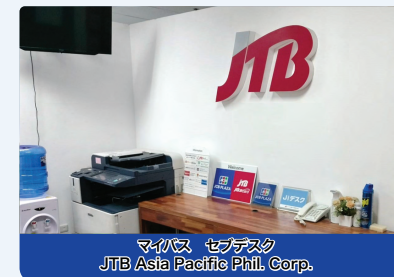
マイバス セブデスク JTB Asia Pacific Phil. Corp.