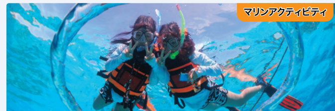
マリンアクティビティ