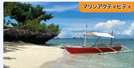
マリンアクティビティ