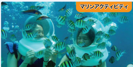
マリンアクティビティ