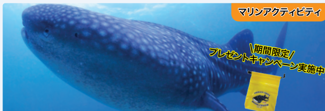
マリンアクティビティ